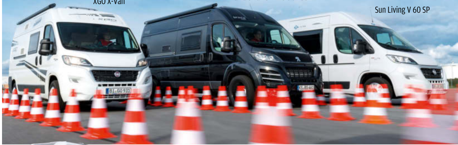
Sun Living V 60 SP