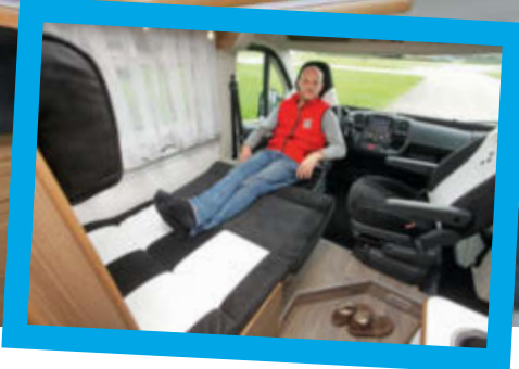
KONTRASTMITTEL Schwarz-Weiß und Holzdekor, die trauen sich was bei Bravia. Das Raumgefühl ist über Geschmacksfragen erhaben, 1,89 Meter Stehhöhe sind sehr okay für diese Kastenwagen-Klasse