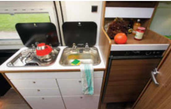
ANRICHTE Die halbhohere Arbeitsfläche ist praktisch und lässt die Küche luftiger wirken