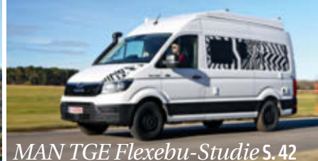
MAN TGE Flexebu-Studie S. 42