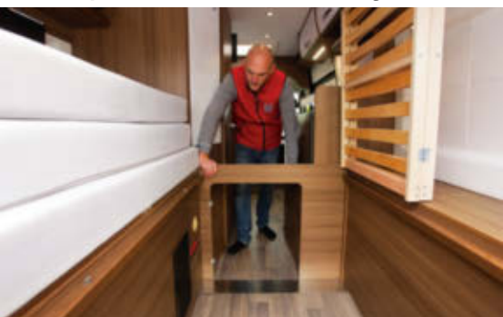
UNFLEXIBEL Bei den Kontrahenten ist die Abtrennung demontierbar, Bravia verzichtet darauf