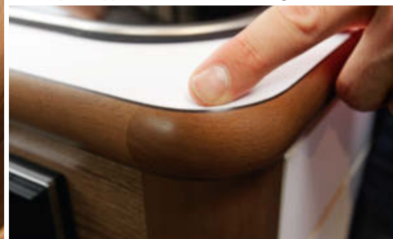
HANDWERK Umleimer von dieser schönen Machart gibt's in der Kastenwagen-Klasse nicht oft