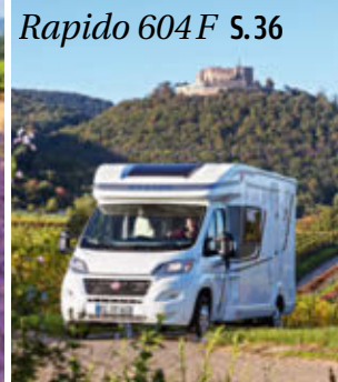
Rapido 604 F S. 36