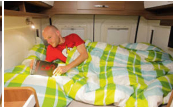
KURZWARE Mit 1,84 Metern ist das Bravia-Bett nicht superknapp, aber das kürzeste im Vergleich